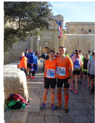
Vor dem Start in Mdina/Rabat