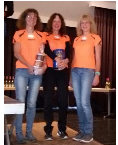
3. Platz Mannschaft Damen